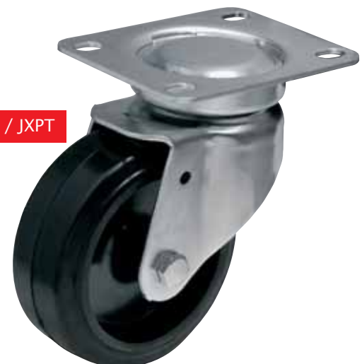
TYP JSPT / JXPT